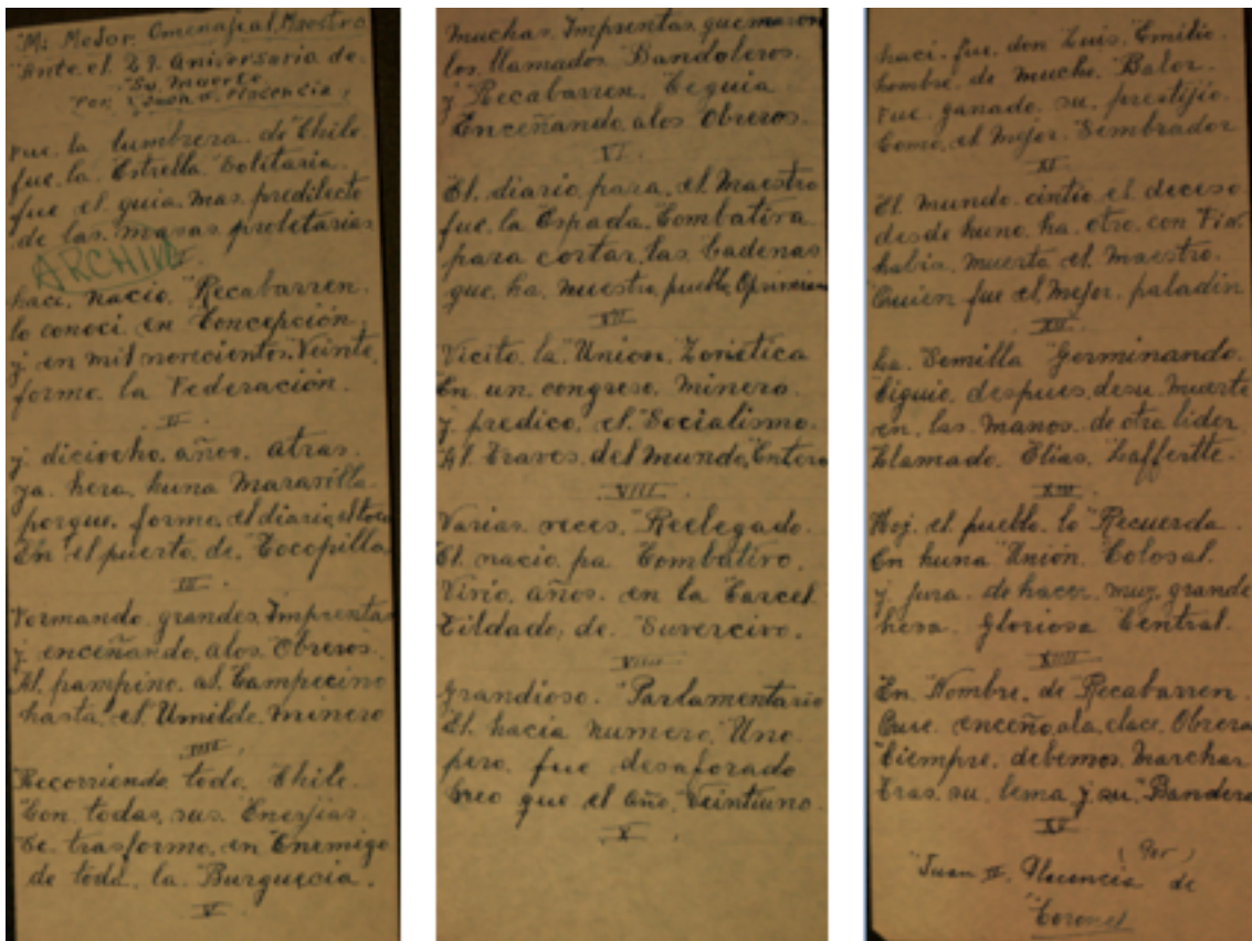
Manuscrito original del homenaje del poeta popular Juan II Placencia a Luis Emilio Recabarren

¿CÓMO FUE QUE REALIZARON EL PRIMER CONGRESO NACIONAL DE POETAS Y CANTORES POPULARES EN EL AÑO 1954?