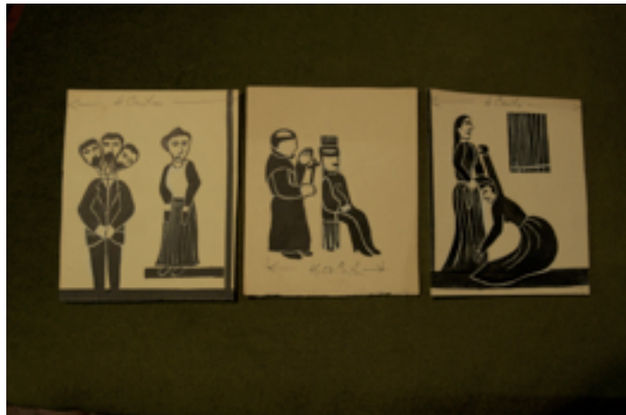
Ilustraciones de la Lira Popular. Grabados populares anónimos

En general eran parecidas a las antiguas Liras Populares, en tamaño de periódico. Nosotros transcribíamos a máquina los poemas que los poetas nos enviaban a mano. Llevaban como ilustraciones grabados muy populares, de autores anónimos. Nunca se ha sabido quiénes fueron los autores.